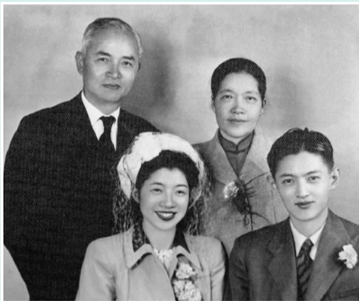
新婚伉俪邹承鲁、李林(前排)与李四光夫妇合影。